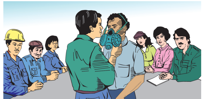
图102b 对所有需要佩戴呼吸防护器的劳动者，都应定期培训其如何使用、护理和维护。

的每位劳动者进行培训，主要内容有：为什么必须使用个人防护用品；什么时候和什么地点应使用个人防护用品；怎样使用个人防护用品；怎样保养个人防护用品。