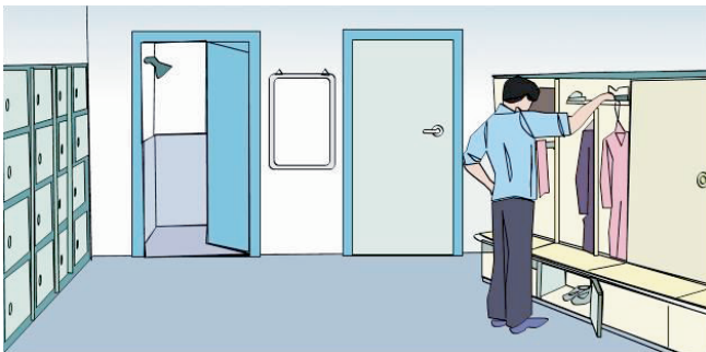
图95a 按性别提供带锁的更衣室，并将衣架分配到劳动者个人。

检查要点 95 提供良好的更衣设施、盥洗设施和卫生设施，并做好维护，以确保良好的卫生和整洁